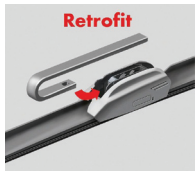
Flatblade smart Retrofit