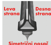
Flatblade smart simetrični nosač