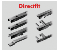
Flatblade smart Directfit